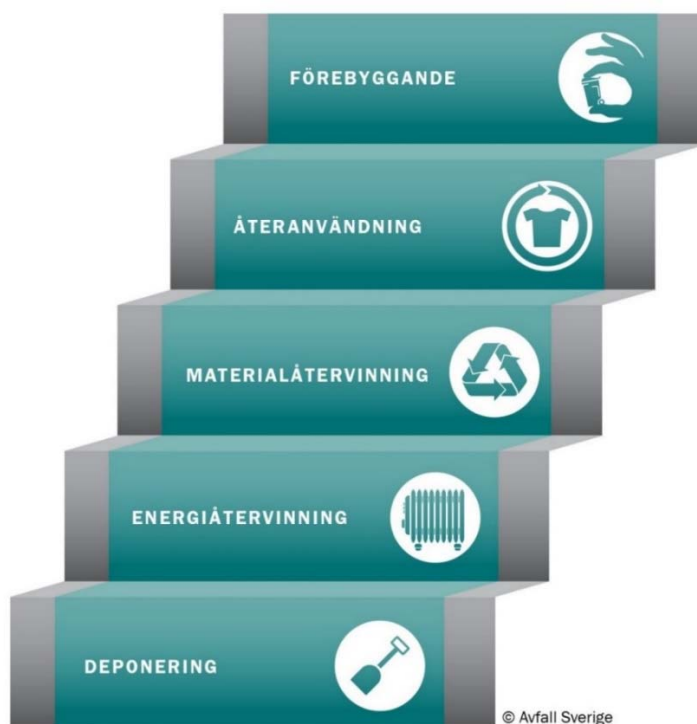
Figur 1. Avfallstrappan

Avfallsplanen avser att skapa en gemensam plattform för kommunalförbundet och dess medlemskommuner, i syfte att utveckla en miljö- och serviceinriktad avfallshantering utifrån EU:s avfallshierarki, som åskådliggörs via den så kallade avfallstrappan.