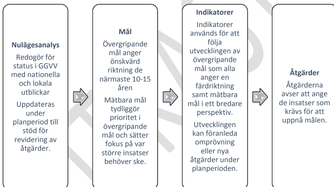
Figur 2. Struktur upplägg kommunal plan för avfallsförebyggande och hållbar avfallshantering

I separat underlag framgår uppgifter på utfall uppföljning avfallsplan, nationella regionala mål och riktlinjer, statistik samt övriga uppgifter som ska framgå av en kommunal avfallsplan.