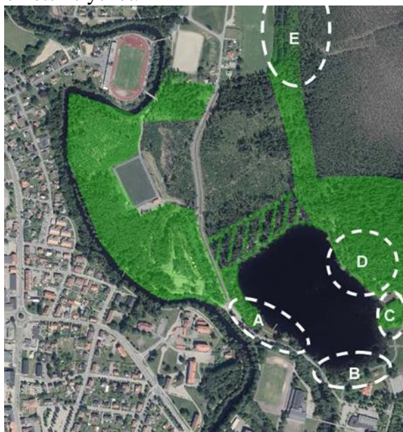
Figur 1. Redigerad flygbild från 2013 visar på särskilt värdefulla skogsområden för centrumnära friluftsliv. Det skrafferade området i bilden är det 100 meter breda skogsområdet som ska regleras i detaljplan eller annat juridiskt gällande dokument.

(1) att Prostsjöområdets skogliga karaktär med barrträdsbestånd ska bevaras och skötas i syfte att säkerställa ett centrumnära friluftsområde med skogskaraktär. Särskilt områdena ni ser i bild nedan (figur 1), och i synnerhet grönområdet mellan sjön och tänkt bostadsområde. Det 100 meter breda skogsområdet ska skyddas och skötas så att skogen aldrig kalavverkas. Detta bör regleras genom bestämmelse i detaljplan eller annat juridiskt gällande dokument. Enstaka siktlinjer ska tillåtas genom barrskogen utan att försämra helhetsintrycket.